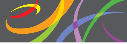
Схема платформы для партнеров